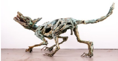
Zyklus „Wald vor Wild“- oder Romantiker sind Freidenker und keine Rückwärtsgewandten

Bonsai aus Verpackungsmaterial in Alu, verlorene Form, auf Tisch