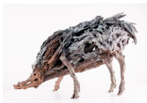
„Wald vor Wild“ - oder Romantiker sind Freidenker und keine Rückwärtsgewandten